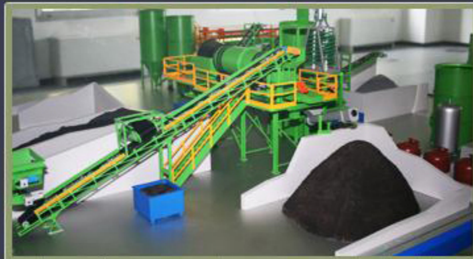
Lavaggio e recupero terre spazzamento stradale particolare modellino Ecocentro Tecnologie Ambientali

Tagged with: cave , Italia , Milano , recupero e riciclo ghiaia , recupero e riciclo sabbia , recupero e riciclo terre spazzamento strada